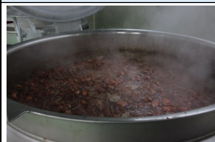
Boiling cod roe