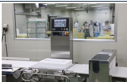
Metal detector / weight checker guarantees the quality.