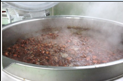
たらこを煮込んでいる様子