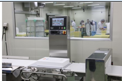
金探・ウェイトチェッカーで品質を管理しています。