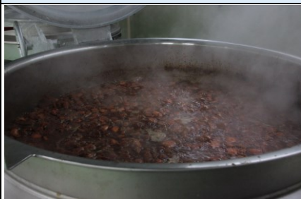
たらこしぐれを煮込んでいる様子