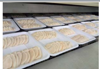
⑨トンネルフリーザー